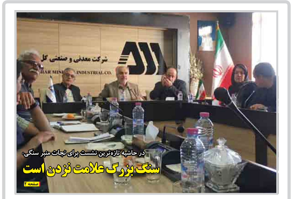
در حاشیه تازه‌ترین نشست برای نجات منبر سنگی؛ سنگ بزرگ علامت نژدن است صفحه ۲

معاون مدیرعامل و مدیر مجتمع گل گهر خبر داد: گل گهر؛ پارک جنگلی ۳۳۰ هکتاری احداث می‌کند صفحه ۶