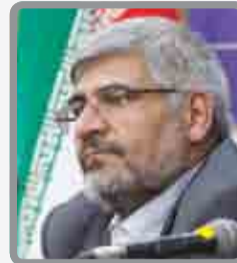
سرپرست فرمانداری در جلسه شورای اداری مطرح کرد: