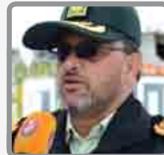
فرمانده جدید انتظامی استان منصوب شد