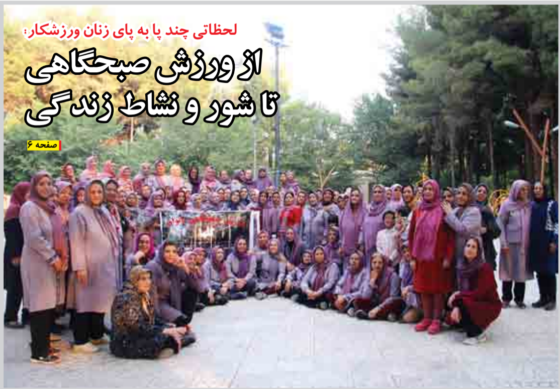
لحظاتی چند پا به پای زنان ورزشکار: