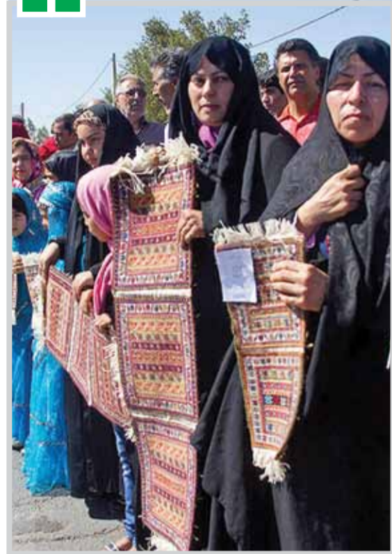
روز جهانی صنایع دستی گرمای باد

سال بیست و یکم • شماره ۱۱۲۹ • شنبه ۱۹ خرداد ۱۳۹۷