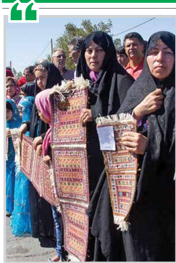
روز جهانی صنایع دستی گرمای باد

سال بیست و یکم • شماره ۱۱۲۹ • شنبه ۱۹ خرداد ۱۳۹۷